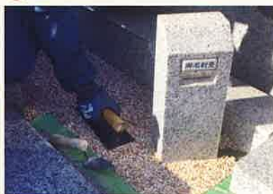
材料を敷いて、コテでならします。