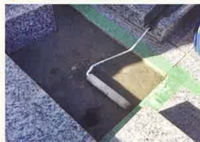
石との密着を高めるプライマーを塗布。