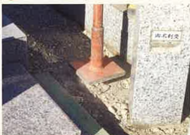
砕石を敷き転圧します。