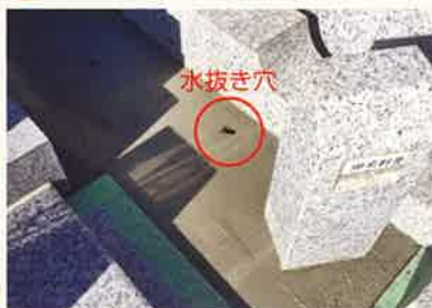
セメント投入し、コテでならします。