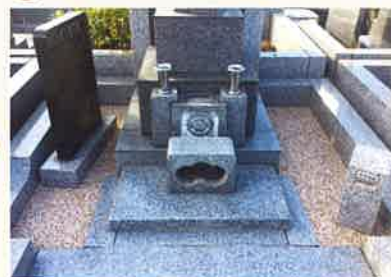
乾燥と養生に一日以上で完成。