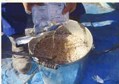
天然石と樹脂を混ぜ合わせます。